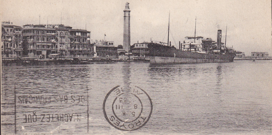
38 PORT-SAID. — Vue sur le Port. — LL