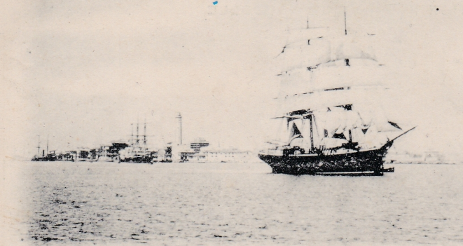
Port de Port Said.