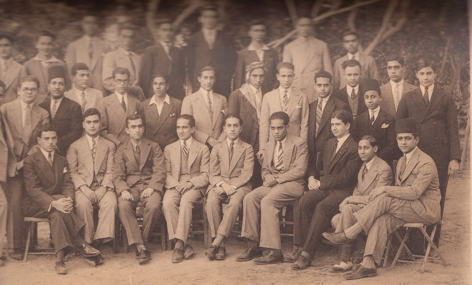
Enseignement Secondaire Egyptien. - Cinquième année.